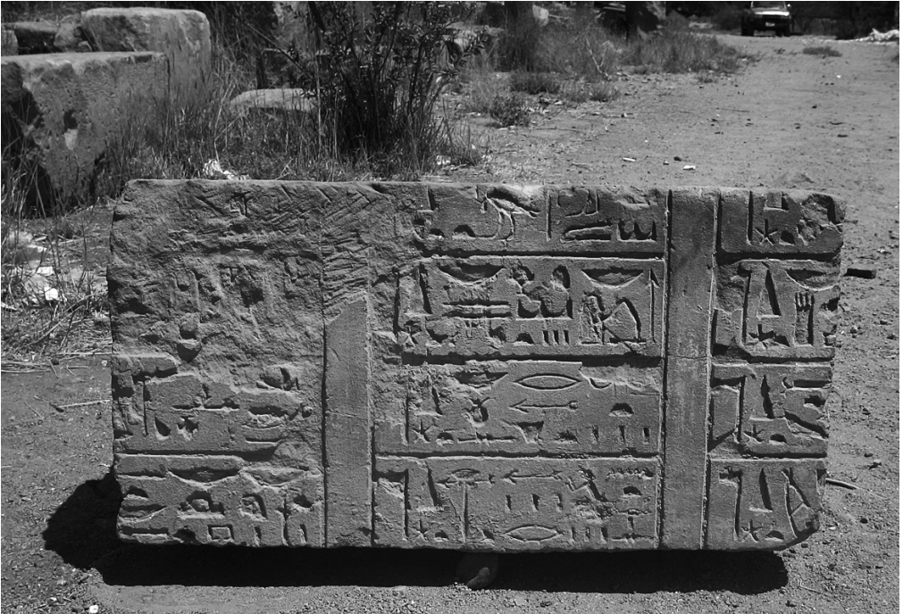
1. Bloc d'Assouan n° ASW 144.

C'étaient donc les troupes de flèches-démons qui formaient la célèbre armée de l'Isis d'Assouan dont la puissance offensive et défensive dépassait largement celle de l'armée terrestre 44 .