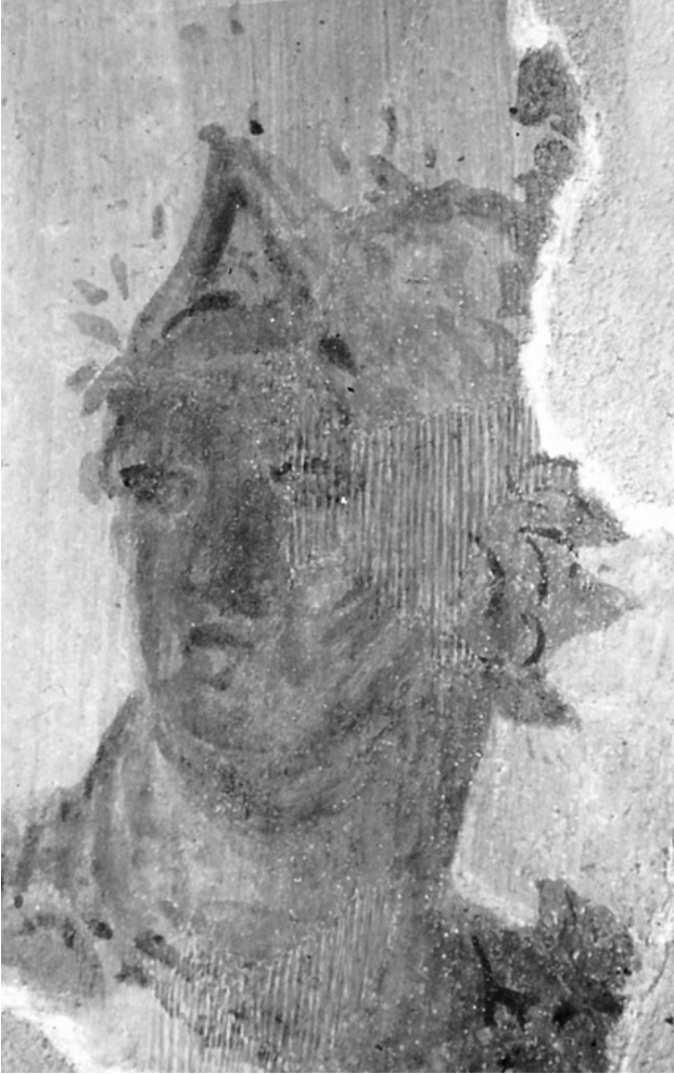
4. Marina El-Alamein, buste féminin coiffé d'une proue de navire.

ne fut remportée par son époux de son vivant. Elle mourut en 270 avant n.è. et ce n'est qu'en 250 avant n.è. que la flotte de Ptolémée II remporta une victoire notable sur celle d'Antigone Gonatas 37 . Rien n'empêchait en ce moment d'ajouter aux vertus de la reine défunte, divinisée depuis de nombreuses années, le triomphe sur mer. Rappelons d'ailleurs qu'un des plus actifs artisans du culte d'Arsinoé II et fondateur de son temple en tant qu'Aphrodite fut Callicratès de Samos, amiral de la flotte de Ptolémée II 38 . Il est curieux que Posidippe, dans une épigramme du recueil récemment découvert (III,1), décrit la divine Arsinoé II, couramment assimilée à Aphrodite, comme portant la lance et le bouclier.