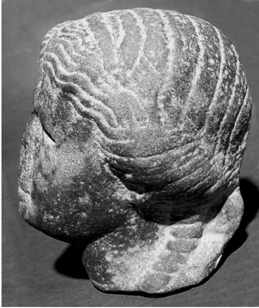
2. Canope Est, tête de Bérénice II, profil gauche.