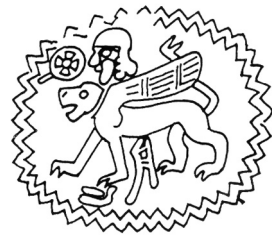
5. Stempelsiegel aus dem Bible Lands Museum, Jerusalem (nach: J.D. HAWKINS, Corpus of Hieroglyphic Luwian Inscriptions , Vol. I, Inscriptions of the Iron Age , Berlin – New York 2000 [= Corpus I ], S. 584, Abb. XIII.14).