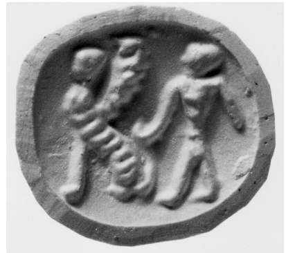
10. Stempelsiegel aus dem Ashmolean Museum, Oxford.

Der nächste Sphinx erscheint auf einem anderen neohethitischen Stempelsiegel aus dem Ashmolean Museum in Oxford. Er ist von einem schreitenden Mann begleitet ( Abb. 10 ). Das Aussehen und die Haltung des Sphinxes sind hier ganz andere. Er sitzt auf seinen Hinterpranken und seine Vorderpranke stützt er auf dem Boden. Seine Haltung erinnert an die Stellung von Sphinxen aus mitannischen Siegeln, wie wir es auf dem Siegel aus dem Rockefellermuseum in Jerusalem sehen können. 36 Das Gefieder des Sphinxes aus diesem Objekt wurde sehr ähnlich bearbeitet, aber die Gestalt seines Flügels ist ander. Außerdem hat er nur einen Flügel und dadurch weicht er von dem Mischwesen aus unserem Siegel ab. Manche Ähnlichkeiten können wir auch im Aussehen der Köpfe von beiden phantastischen Wesen bemerken.