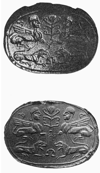
9. a und b. Stempelsiegel aus Genf (nach: M.L. VOLLENWEIDER, Catalogue raisonné des sceaux, cylindres et intailles , Bd. I, Genf 1967, S. 114, Nr 144).

tischen Orthostaten verbindet. Die letzten nahmen dagegen ohne Zweifel die hethitischen Darstellungen von Sphinxen zum Vorbild. Eine deutliche Ähnlichkeit den Sphinxen aus syrischen Stempelsiegeln im Vorderasiatischen Museum 29 mit den Sphinxen aus neohethitischen Siegeln, besonders im Bereich der mit den Vögelköpfen beendeten Schwänzen, ist höchstwahrscheinlich ein Erfolg der Entlehnung aus dem neohethitischen Verzierungsspektrum. Die Sphinxen aus älteren syrischen Zylindersiegeln haben nämlich nicht das charakteristische Element. 30