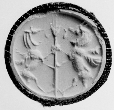
13. Stempelsiegel aus dem Ashmolean Museum, Oxford.

Orthostaten aus Zincirli/Sam 3 al. 47 Trotz sichtbarer Unterschiede im Aussehen ist das grundlegende Verzierungsschema in beiden Fällen gleich, obwohl das Greif aus Zincirli nicht von dem gleichen Mischwesen und vom Baum begleitet ist.