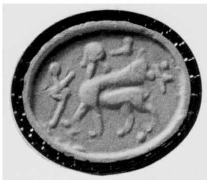
4. Stempelsiegel aus dem Ashmolean Museum, Oxford.

wurden dagegen anders dargestellt, mit Hilfe der kurzen, schräg geordneten Strichen, also auf diese Weise, die für syrische Gefiederdarstellungen charakteristisch ist. 9