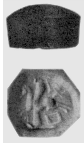
16. Stempelsiegel aus Birmingham (nach: LAMBERT, Iraq 28, Abb. 73).

Museum befindet, abgebildet. 50 In diesem Fall können wir jedoch einige Unterschiede bemerken. Vor allem ist nur ein Flügel sichtbar, der über dem Körper des Pferdes angelegt wurde. Sein Schwanz ist erhoben und seine Vorderbeine sind waagrecht angeordnet und nach vorn ausgestreckt. Höchstwahrscheinlich wollte ein Handwerker hier nicht einen Galopp sondern einen Flug abbilden. An syrische Vorbilder knüpft deutlich die Bearbeitung des Gefieders der Pferde auf den Siegeln aus Paris und aus der Sammlung de Clercq an (vgl. Abb. 14 u. 15 ). Auf gleiche Weise bearbeitetes Gefieder haben der sitzende Sphinx und der Greif auf den Stempelsiegeln aus dem Ashmolean Museum (vgl. Abb. 10 u. 11 ). Als Beispiele dieser syrischen Vorbilder können wir Flügel der Sonnenscheiben und der phantastischen Wesen aus nordsyrischen Zylindersiegeln aus der zweiten Hälfte des 2. Jahrtausends v.u. Z. hinweisen. 51