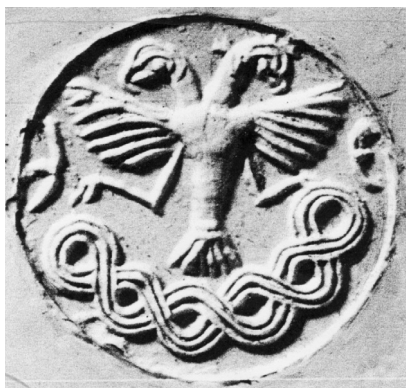
3. Stempelsiegel aus Hattusha (nach: BITTEL, Die Hethiter , Abb. 78).