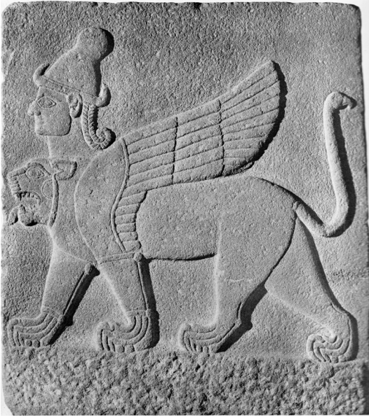
7. Orthostatenrelief aus Karkamiš (nach: AKURGAL, Arte Ittiti , Abb. 110).

äußeren Seite des Torgebäudes in Zincirli/Sam'al dargestellt. 27 Er schreitet wie die Mischwesen auf den Siegeln aus Jerusalem und Oxford und erinnert an sie nicht nur mit der Haltung aber auch mit dem Körperbau. Aus derselben Stadt stammt auch ein anderer Orthostat mit der Darstellung von einem schreitenden Sphinx, der einst die östliche Seite des Tores D verzierte. 28 Dieses Mischwesen hat nur einen, menschlichen Kopf, am stärksten erinnert es also an den Sphinx aus dem Siegel aus Oxford. Es hat einen ähnlich verlängerten Löwenkörper, seine Löwenpranken sind in derselben Stellung gebildet und sein erhobener Schwanz ist mit einem Vogelkopf beendet. Dieser Sphinx aus Zincirli/Sam'al trägt dieselbe Frisur wie ein Mischwesen auf dem Siegel aus Oxford, er hat aber keinen Bart. Trotzdem scheint er die nächste Entsprechung für den Sphinx aus dem Skarabäoid aus Oxford zu sein.