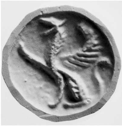
11. Stempelsiegel aus dem Ashmolean Museum, Oxford.

Ein neohethitisch Stempelsiegel, das aus einer Basis in der Form einer Halbkugel und einem Griff in der Form einer Faust mit einem hervorragenden Daumen besteht und auch im Ashmolean Museum in Oxford aufbewahrt ist, ist mit der Darstellung eines Greifs verziert. Dieses Mischwesen hat einen Löwenkörper mit einem großen Flügel und einem