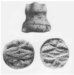
1. Stempelsiegel mit dem hammerförmigen Griff (nach: KEEL-LEU, OBO 110, S. 62, Nr 75).

Die Siegel, die mit den Darstellungen von Mischwesen verziert sind, sind vorwiegend Skarabäoide. Diese Form des Siegels, die auf dem ägyptischen Skarabäus basiert, drang bis an Syrien durch die Vermittlung von phönizischen Küstenstädten, die sie im allgemeinen Anfang des ersten Jahrtausends v.u.Z. adaptierten. 1 Nur ein Siegel hat andere Gestalt. Es besteht nämlich aus einer runden Basis und einem hammerförmigen Griff und knüpft eindeutig an die hethitischen Vorbilder an. 2