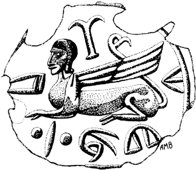
6. Stempelsiegel aus Yale Babylonian Collection, Princeton (nach: G. BECKMAN, A.M. BROWN, Some New Stamp Seals from the Yale Babylonian Collection , OA XXIV, 1985, S. 241, Nr 1).

Prankenendungen nähern sie am stärksten dem Sphinx auf dem Objekt aus Yale. Sehr ähnlich ist auch die Gestalt der Flügel, aber ihr Gefieder bei Sphinxen aus syrischen Stempelsiegeln wurde auf andere Weise, mit Hilfe den kurzen, schräg geordneten Linien wiedergegeben.