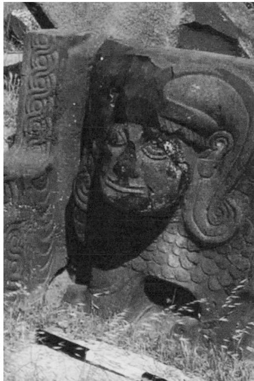
8. a und b. Orthostatenreliefs aus Ain Dara.