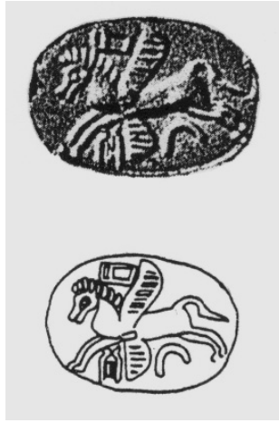
15. Stempelsiegel aus der ehemaligen De Clercq Sammlung (nach: HAWKINS, Corpus I , Nr 584, Abb. XIII.16).