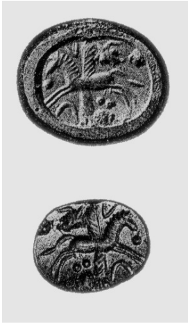
14. Stempelsiegel aus der Nationalbibliothek in Paris (nach: HAWKINS, Corpus I , Nr 577, Abb. XIII.5).