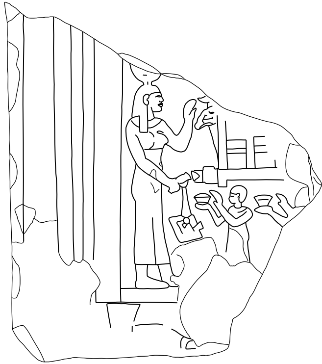
3. Stèle d'Éléphantine (dessin E. Laskowska-Kusztal).

La stèle d'Éléphantine, liée à l'enceinte cultuelle de la nécropole des béliers sacrés ( fig. 3 ) 42 , constitue une autre référence, différente de la précédente, à la relation entre Khnoum-bélier, assimilé à la crue du Nil, et la divinité féminine déclenchant ou produisant la crue. La scène représente une momie de bélier, dissimulée dans une litière, devant laquelle accomplit une libation sur l'autel en forme de « T » 43 une figure féminine coiffée de la couronne hathorique avec disque entre les cornes. Devant le dieu se trouvent aussi deux prêtres qui portent des offrandes.